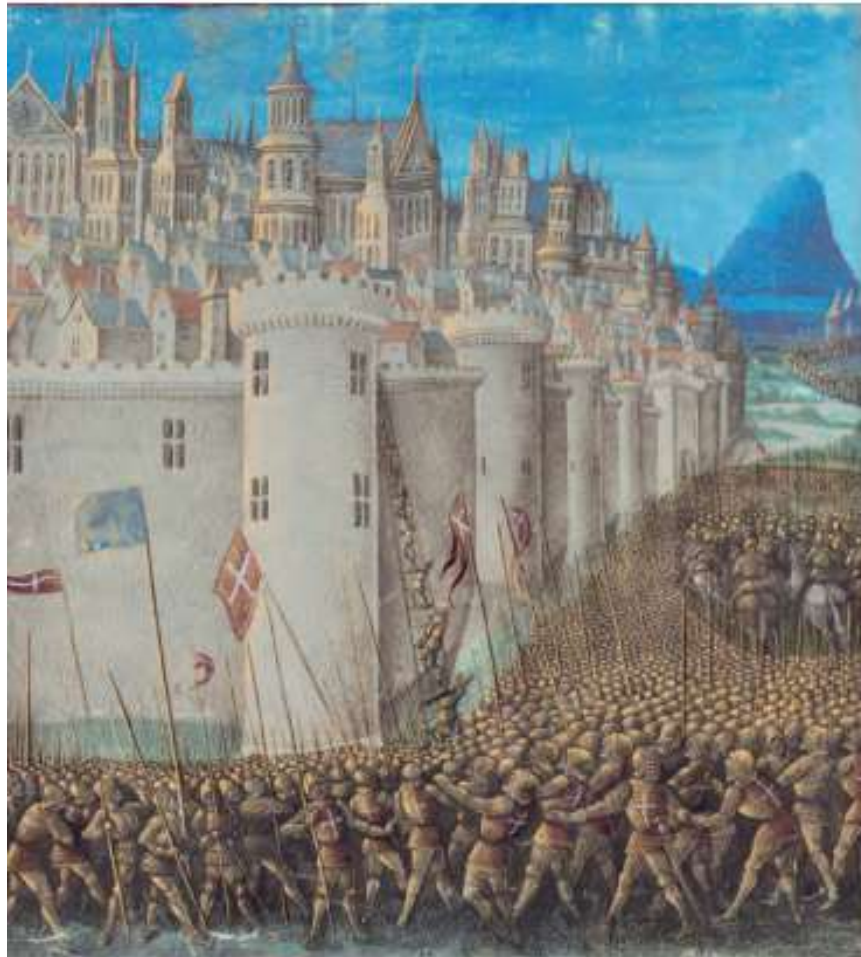
B Representación del asedio de Antioquía (1474), [miniatura medieval].

En el siglo X tropas cristianas intentan recupera la ciudad de Antioquia, la cual había sido arrebatada al Imperio bizantino por los musulmanes.