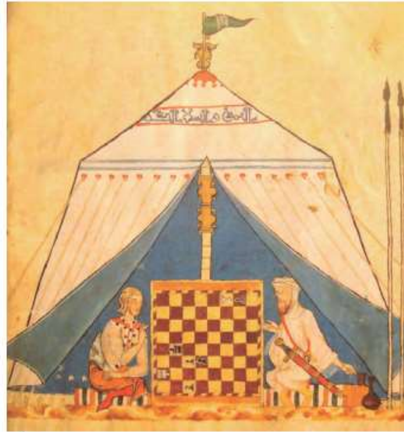
C Libro de los juegos (1252-1284). Cristiano y musulmán jugando al ajedrez.

En el siglo X tropas cristianas intentan recupera la ciudad de Antioquia, la cual había sido arrebatada al Imperio bizantino por los musulmanes.